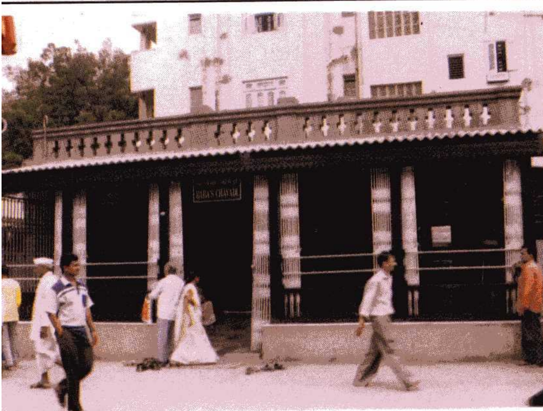
Shri Sai Baba's Chawadi