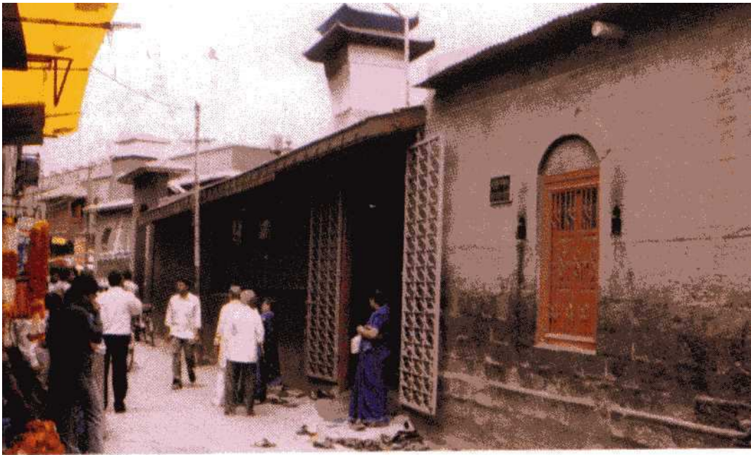
Shri Sai Baba's Dwarkamai