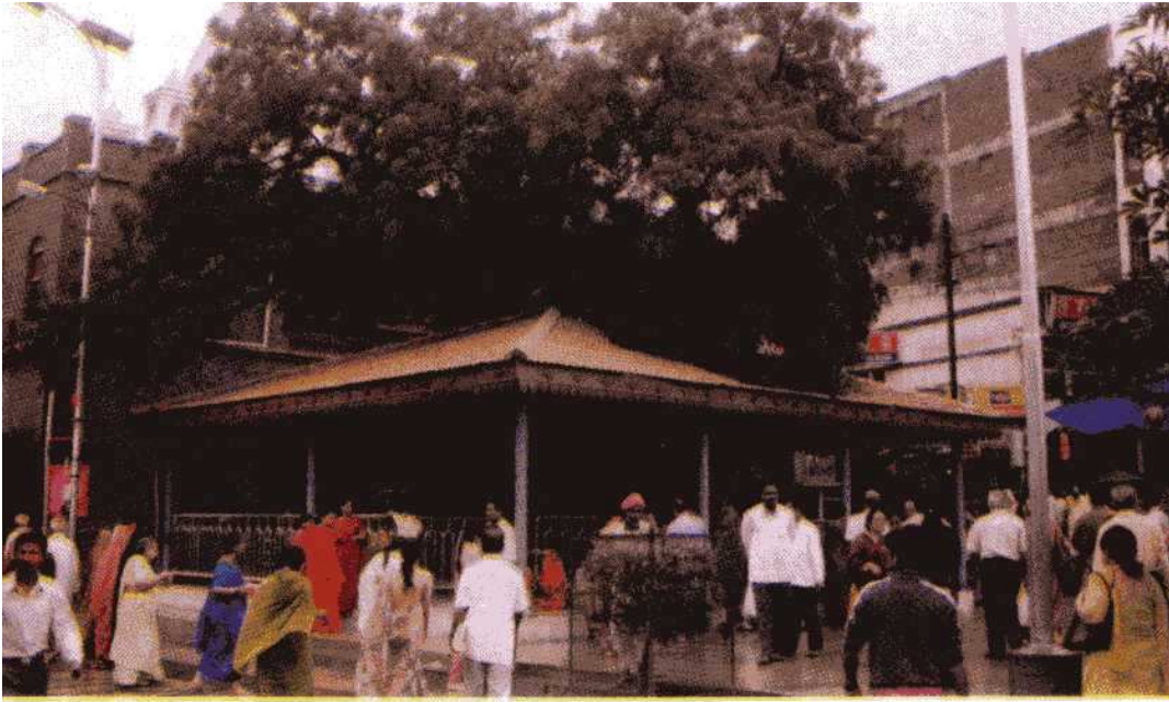
Shri Sai Baba's Gurusthan